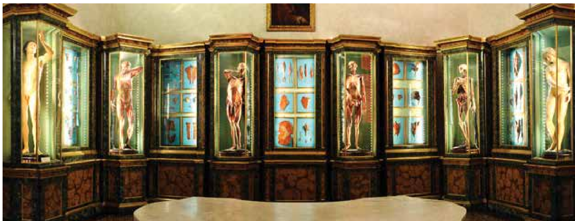
Museo di Palazzo Poggi, le cere anatomiche

L'ingresso al Museo e le visite guidate saranno gratuiti