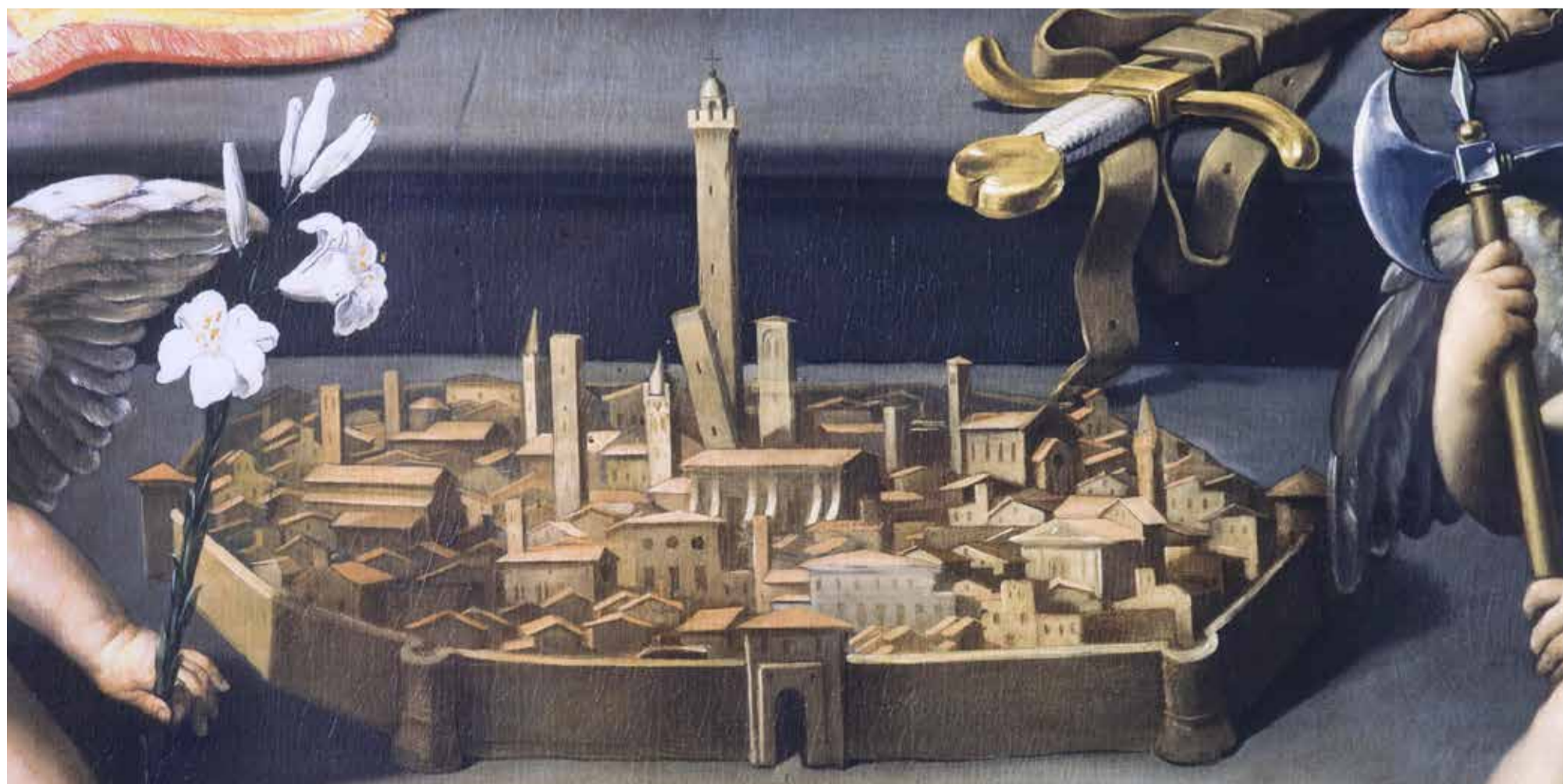
Guido Reni, Pala dei Mendicanti , 1614-16, particolare (Pinacoteca Nazionale di Bologna)

Le parasonnie sono disturbi del comportamento, emotivi e del sistema nervoso autonomo che intervengono durante il sonno e possono manifestarsi durante ogni stadio, inclusi il sonno REM (Rapid Eye Movements) e quello Non-REM, e durante il sonno vigile o negli stati transitori sonno-veglia. Il sonno nel suo insieme è portatore di una vulnerabilità alle parasonnie. Alcuni comportamenti istintuali possono emergere patologicamente con le parasonnie, come aggressione, consumo di cibo, attività sessuale, locomozione e terrore. Si tratta complessivamente di comportamenti istintuali che possono diventare patologicamente intrecciati in mondo da automantenersi. Usando dei video e dei casi clinici saranno illustrate e discusse le parasonnie, la ricerca attuale sul Disturbo comportamentale del sonno REM e il forte legame di quest'ultimo con il morbo di Parkinson e la demenza.